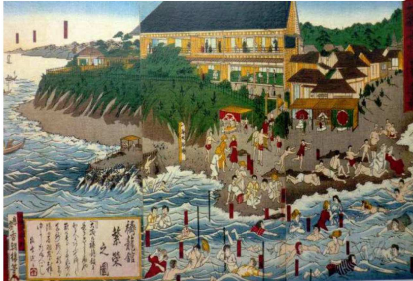
歌川国貞（3代）「禰龍館繁栄之図」