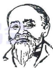
初代・5代・7代・10代 伊藤博文