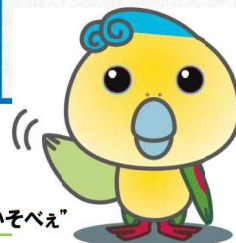
大磯町観光キャラクター「いそべえ」