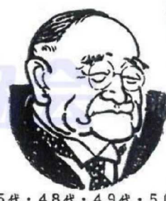
45代・48代・49代・50代 51代 吉田茂