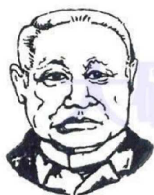
12代・14代 西園寺公望