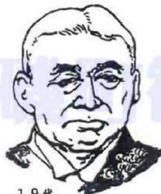
19代 原 敬