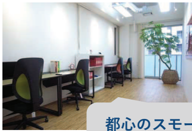
都心のスモール オフィスから・・・

※本施設で法人登記してくれる会社にはコワーキングスペース利用や休日の合宿利用を優遇し、顧客の抱え込みも併せて実行する。