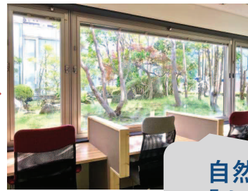
自然豊かな 「大磯本社」